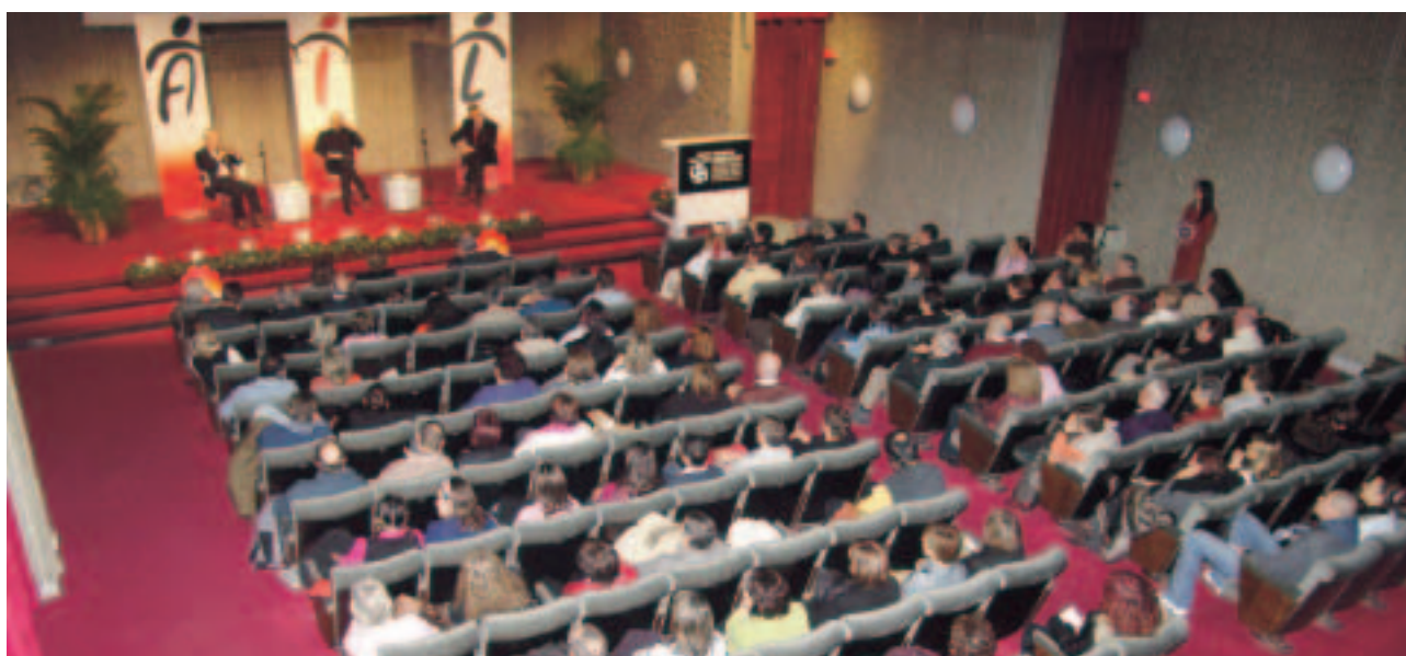
Seminario "Istiocitosi a cellule di Langerhans", Trento, febbraio 2005

Grazie AIL. L'impegno dell'Associazione stimola i medici e tutti gli operatori del Centro a non far mancare nulla ai piccoli pazienti oncologici di quanto la medicina possa offrire. In particolare grazie e complimenti all'AIL - Trentino.