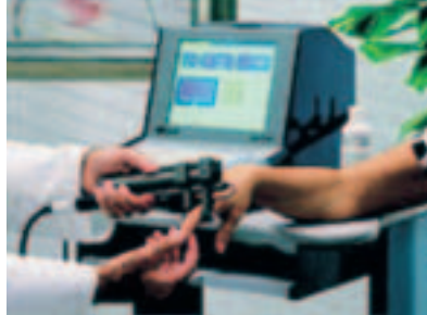
L'apparecchiatura donata alla Pediatria di Trento

Si tratta di un apparecchio che determina la maturazione e lo stato di densità dell'osso e che utilizza una metodica ad ultrasuoni, considerata oggi la metodica strumentale da preferirsi in età pediatrica perché risparmia le radiazioni ionizzanti della tecnica tradizionale a raggi X, è di facile impiego, dà la possibilità di avere curve di percentuali di confronto per la popolazione normale,