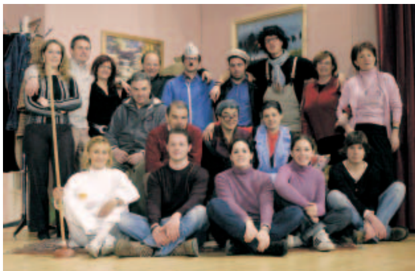
Filodrammatica Parrocchiale di Fondo