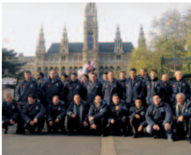
Coro Cima Verde

ni presentati. L'AIL - Trentino desidera ringraziare vivamente gli organizzatori e i partecipanti per la sensibilità che ogni anno dimostrano attraverso una concreta solidarietà nei confronti della nostra Associazione.