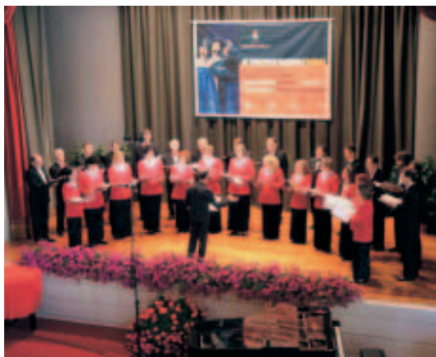
Corale di Lavis