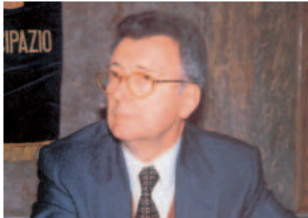
Professor Luigi Zanesco

Da questo dato di fatto emergono due impegni pressanti ai centri di diagnosi e cura delle neoplasie pediatriche: il primo riguarda il 20% di bambini che non guariscono. Essi devono essere sottoposti a una ricerca approfondita, metodica, fondata su casistiche internazionali. Infatti, per capire quali benefici dare a questi bambini, occorre studiare non le poche unità che ognuno dei centri di cura si trova in casa, ma le centinaia di bambini con caratteristiche simili studiate insieme in tutti i centri del mondo cosicché si